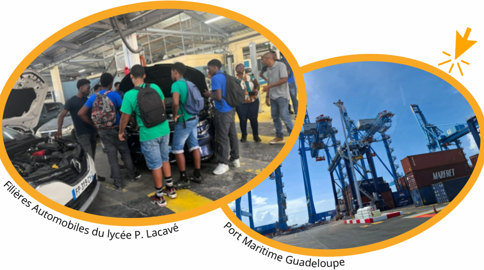
Filières Automobiles du lycée P. Lacavé