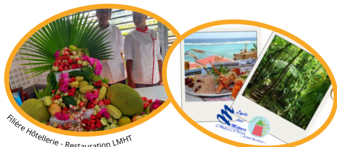
Filière Hôtellerie - Restauration LMHT

La filière HÔTELLERIE-RESTAURATION-TOURISME : une filière d'avenir pour la Guadeloupe